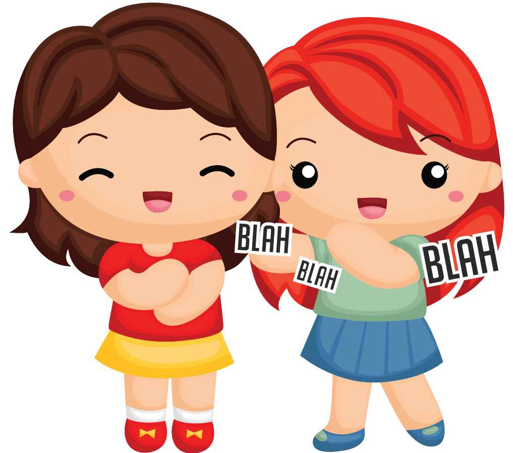
Tere e Inés conversaban y se reían